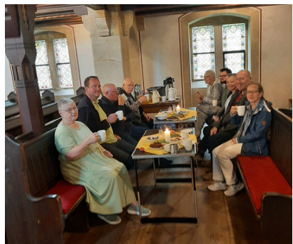
Das frisch eingerichtete Kirchencafé in St. Martin