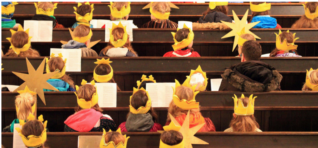
Sternsingerempfang 2013 - Foto: Thomas Dittert